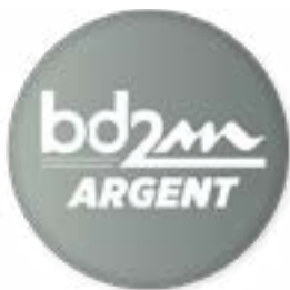
NIVEAU ARGENT 60 points